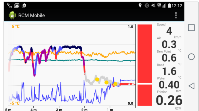
Capture d'écran de l'interface utilisateur avec les mesures de température et de l'état de chaussée.